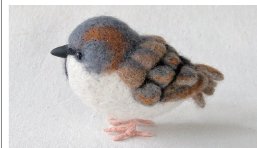
ケニヤスズメ (Kenya Sparrow) Passer rufocinctus

スズメ属のなかでも最も繁栄している種で、ユーラシア大陸西部、南北アメリカ、オーストラリアと広く分布している。