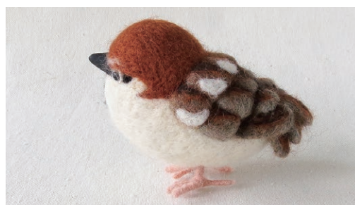
ニューナイスズメ (Russet Sparrow) Passer rutilans

ユーラシア大陸の広い範囲に分布。 ヨーロッパでは、農耕地帯で見られ都市部にはほとんどいない。