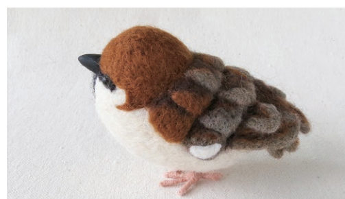
クリバネスズメ (Somali Sparrow) Passer castanopterus

南アフリカの草原や人里にいるスズメ。 南アフリカの1セントコインの図柄にもなっています。