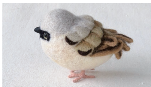
サバクスズメ (Desert Sparrow) Passer simplex

イベリア半島や北西アフリカから南ヨーロッパ、中央アジアにかけての不毛な岩場で繁殖する。スズメ科の親世代に当たる種であることが示された。