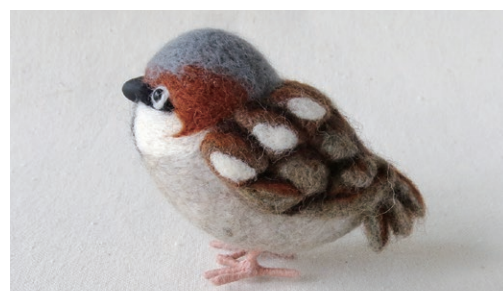
イエスズメ (House Sparrow) Passer domesticus

北はロシア、東は日本、南はインド、西はアフガニスタンまで、東アジア、東南アジア、南アジア、中央アジアに広く分布する。頬に黒点がなく、森や林に生息する。