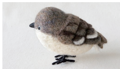
ユキスズメ (Snowfinch) Montifringilla nivalis

北アフリカおよび中央アフリカと、イランからロシアにかけての砂漠や砂地に生息する。人を恐れず、民家の泥壁を利用して巣を作ることがある。