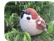
旅するすずめ チュン太郎

作品をご覧になり「にっこり」 手に取って「ほっこり」 気持ちが「ゆったり」 心癒される羊毛フェルト作品を 作り続けています。