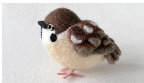
スズメ (Tree Sparrow) Passer montanus

参考: 小宮輝之/かわいいスズメたち (二見書房) 世界鳥類辞典 同朋舎 ウィキペディア http://www.oiseaux.net https://ebird.org