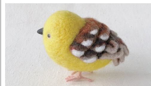
コガネスズメ (Sudan Golden Sparrow) Passer luteus

サハラ以南のナイジェリアからスーダンにかけて分布する。開けたサバナ、半砂漠、灌木の生える乾燥地、穀類の畑地を好む。