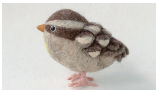
イワスズメ (Rock Sparrow) Petronia petronia

チャド南部、スーダン、ソマリア、ウガンダ、ケニア、タンザニアに分布する。木の生えた乾燥したサバナや町を好む。