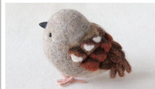
ミナミハイガシラスズメ (Southern Grey-Headed Sparrow) Passer diffusus

ユーラシア大陸 (スペインからモンゴル) の山岳荒地など、鳥類の中でも最も高地に生息するものの一つで、雪解け地付近の岩の上や地上で小郡をなしている。