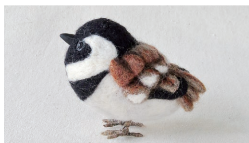
ホオグロスズメ (Cape Sparrow) Passer melanurus

地中海沿岸 (スペイン、コルシカ島、サルデーニャ、シチリア、ギリシャ、北アフリカ) と南アジアの温暖な地域に分布する。イエスズメと似ており、種間雑種を作る。