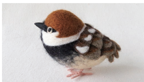
スペインスズメ (Spanish Sparrow) Passer hispaniolensis

地中海沿岸 (スペイン、コルシカ島、サルデーニャ、シチリア、ギリシャ、北アフリカ) と南アジアの温暖な地域に分布する。イエスズメと似ており、種間雑種を作る。